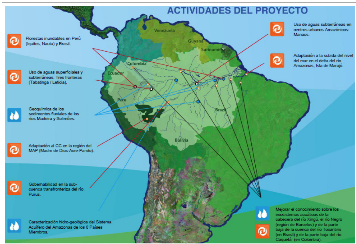
Figura 1: Mapa das Atividades do GEF Amazonas

Com a Agência Nacional Água, ANA-Brasil, no âmbito da cooperação Sul-Sul, houve oito cursos de formação técnica de mais de 220 profissionais de oito países nas áreas de gestão de recursos hídricos, hidrossedimentologia, plataforma de coleta de dados, bacias pedagógicas, direito internacional das águas e dos eventos extremos. (OCTA, 2015b, p. 2)